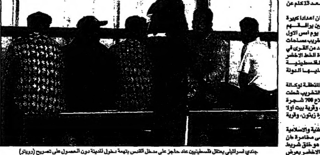
جندي اسرائيلي يعتقل فلسطينيين عند حاجز على شمال القدس بتهمة دخول للبلدة دون الحصول على تصريح